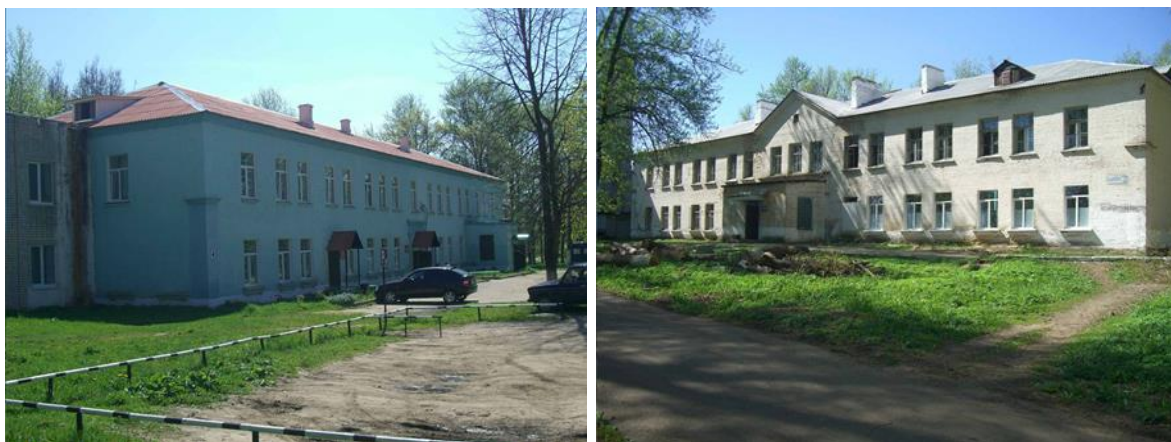
Здания комплекса Рославльской РКБ. В годы войны – корпуса лазарета ДУЛАГА 130

районная больница. Сохранилось также и здание комендатуры лагеря. Сейчас в нем находится торговый центр.