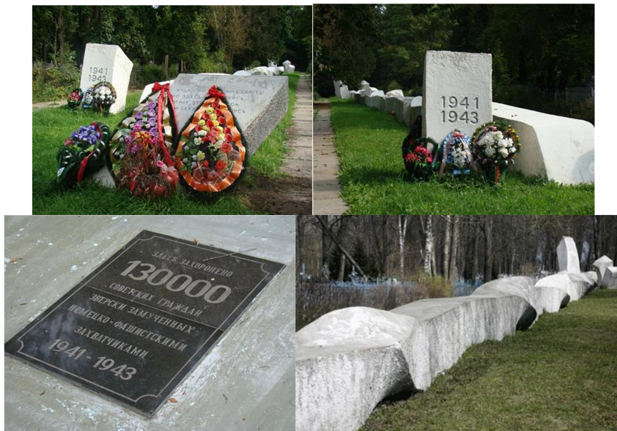
Мемориал на Вознесенском кладбище г. Рославль

В 60-х годах XX века на Вознесенском кладбище был установлен памятный мемориал из железобетона в форме закручивающейся горизонтально расположенной прямоугольной призмы, вытянутой вдоль протяжения всей братской могилы.